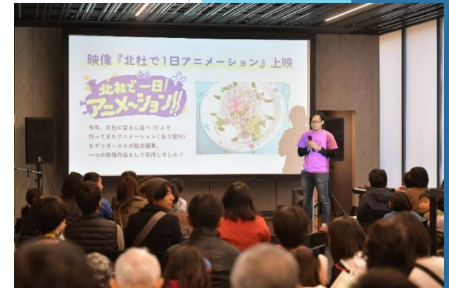
映像祭 「北杜で1日アニメーション」