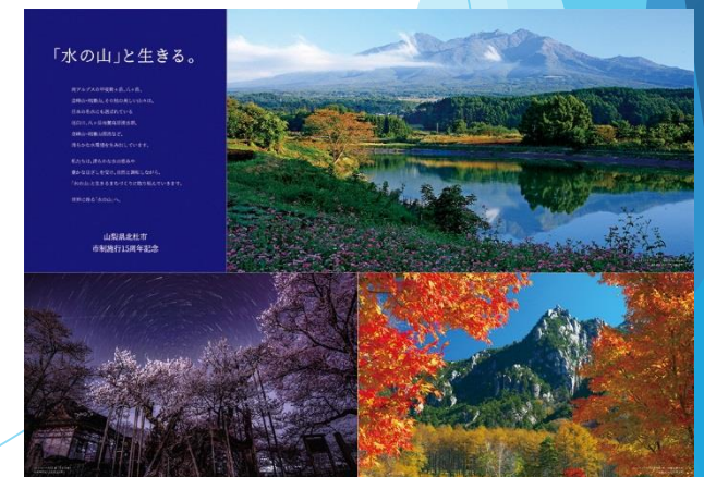
フォトコンテストポスター