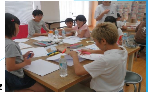
アニメーション制作教室