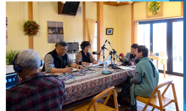
ラジオ番組収録（FM八ヶ岳小淵沢スタジオ）