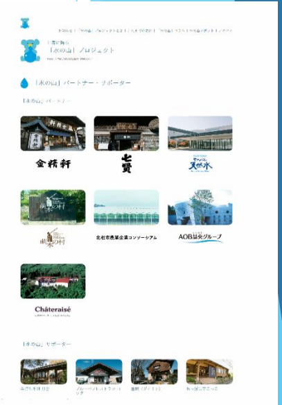
パートナー・サポーターのページ