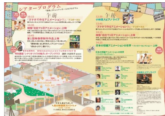
映像祭 パンフレット