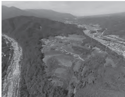
中山工区内遺跡全景（東から）

しかし、住居の造りや出土品の共通性から、このような単位をいくつも特定できれば、集落の構成や変遷を知る大きな手掛かりになるでしょう。