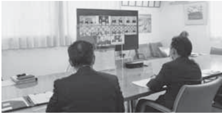
オンラインでの初会合の様子

査が行われています。今後、沿線自治体間で一致団結して陳情・要望などの建設に向けた活動を行い、早期事業化・早期開通を求めていく方向です。