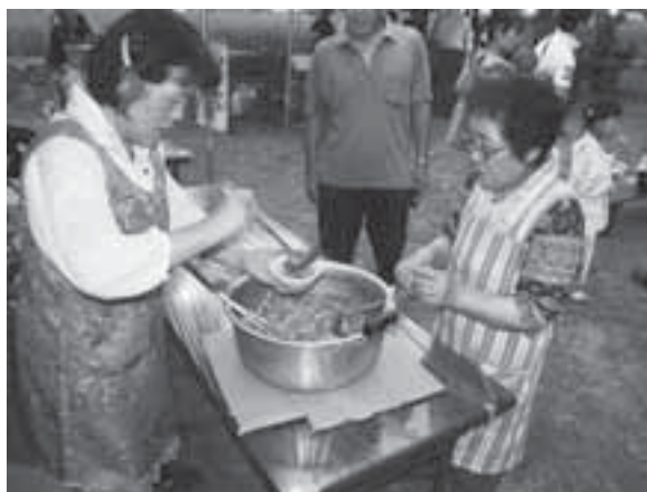
参拝者に振る舞われる小豆ほうとう