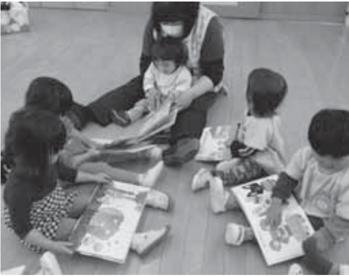
▶市内全ての保育園に新しい本が配布されました。