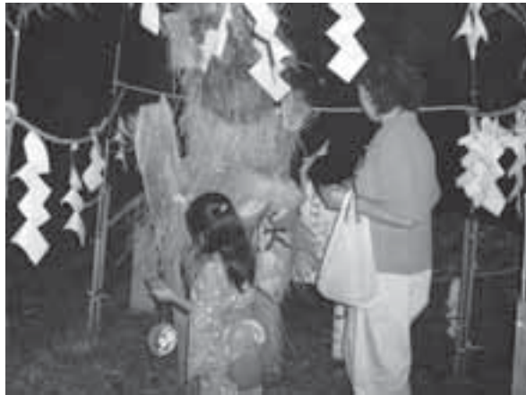
大きな藁人形に穢 けがれ を託します

現在でもお祝いの日には赤飯を食べるように、邪気を払う色とされる赤色をした小豆はおめでたいものであり、小豆ほうとうは、祭りなどのハレの日の御馳走でした。小豆ほうとうを夏の祭りの日などに食べる慣習は白州町や韮崎市にもあり、峡北地域では夏の儀礼食として広く親しまれていたのです。