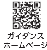
ガイダンス ホームページ

※北杜市・斐崎市合同就職ガイダンスホームページで企業情報、求人内容、ガイダンスの流れなどを確認できます。