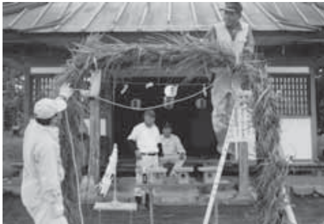
皆で協力しながら骨組みに茅を結び、大きな茅輪をつくります。

高根町小池にある船形神社で毎年6月30日に行われる茅の輪くぐりもその一つです。この日、太さ30cm、直径2mくらいの長さの茅輪が境内に作られます。参拝者が列となりこの輪の中を最初は左回り、次に右回り、最後に左回りと3回くぐります。この時、先に紹介した拾遺和歌集の歌や「船形の神の御前に身曾責して憂きことこそ六月の空」などの「唱え言葉」を唱えながら、半年間の罪や穢れを祓い、無病息災と五穀豊穣を祈るのです。神事を終えると、茅輪を8つに切り、神社前の前田川に流して、憂いを祓います。