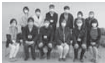
北杜市の地域づくりは、介護支援課と社協とで“ガッチリ”取り組んでいきます。