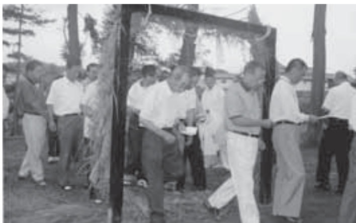
お唱えをしながら茅輪をくぐり、罪や穢れを祓います。

船形神社の茅の輪くぐりは、市内における「夏越の祓」を伝える貴重な民俗行事として、市の無形民俗文化財に指定しています。