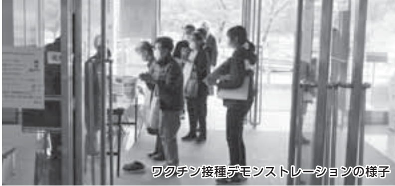
ワクチン接種デモンストレーションの様子