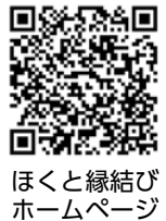
ほくと縁結びホームページ