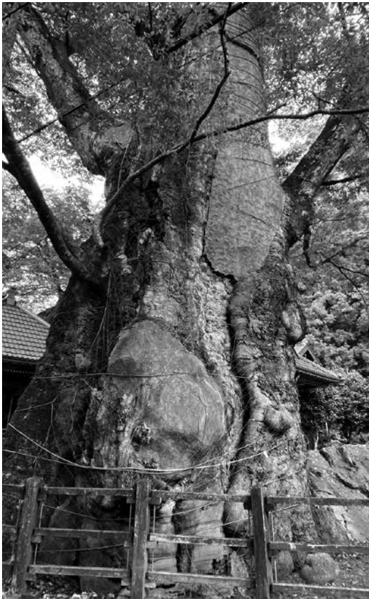
根古屋神社の大ケヤキ(畑木) 今年度樹幹の保護対策を実施した