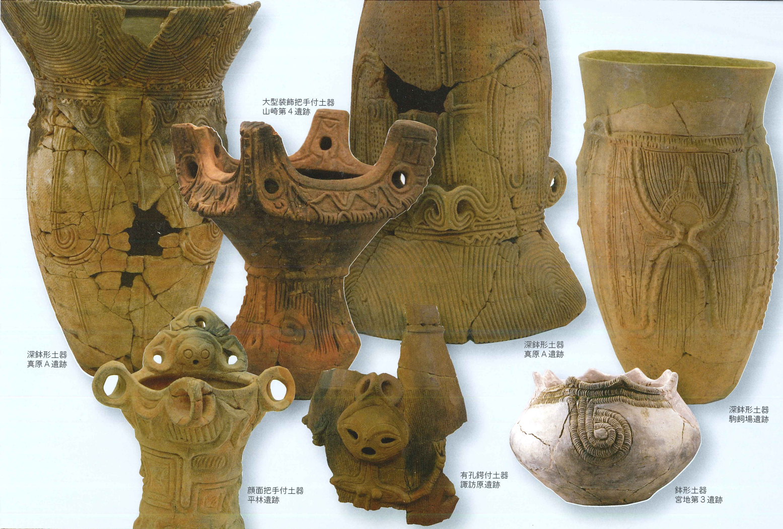
大型裝飾把手付土器 山崎第4遺跡