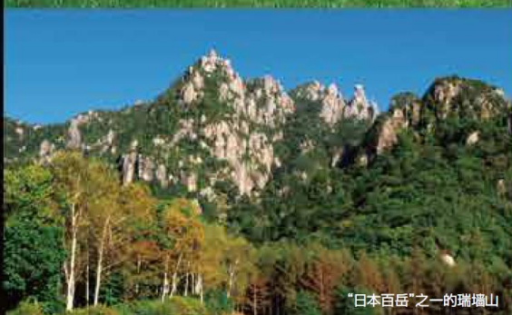
山岳与大自然森林 “日本百岳”之一的瑞墙山 北杜市耸立着5座“日本百岳”，还有16座“山梨百岳”。