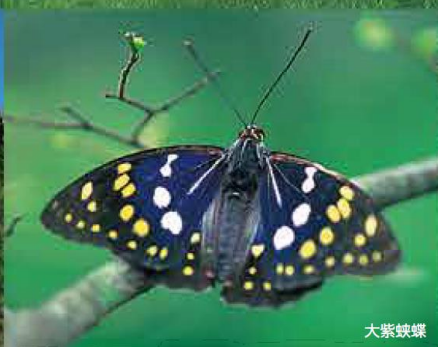
深绿森林 大紫蛱蝶 日本国蝶——大紫蛱蝶，6月到8月间可见优雅的舞姿。