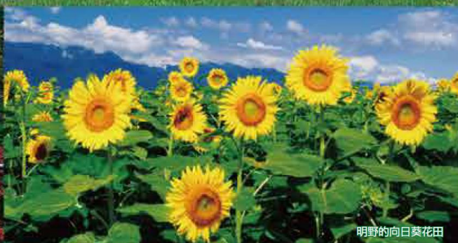
闪耀太阳的森林 明野的向日葵花田 每年日照时间长达2500小时以上，以日本第一而自豪。近几年，致力于太阳能发电的活用。