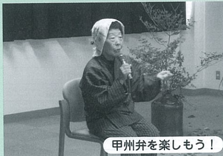
甲州弁を楽しもう!

日 時：10月27日(日) 午後1時30分～ 会 場：はくしゅう館2階会議室 参 加 料：無料 対 象：一般 内 容：地域にまつわる伝説や民話、昔話などを甲州弁で語る 出 演：ハヶ岳甲州弁だいすきの会 問い合わせ：ライブラリーはくしゅう