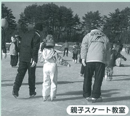
親子スケート教室

日時：11月9日(土) 会場：白州体育館 参加料：無料 対象：市内在住の65才以上 主催：北杜市スポーツ推進委員協議会 問い合わせ：生涯学習課（社会体育担当）