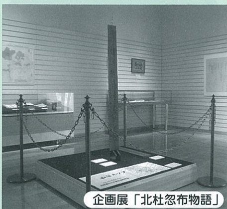
企画展「北杜忽布物語」

日時：10月19日(土)・11月9日(土) 午後1時30分～3時 会場：浅川伯教・巧兄弟資料館 参加料：500円(資料代、観覧料を含む) 対象・定員：一般・15名(要予約・先着順) 問い合わせ：浅川伯教・巧兄弟資料館