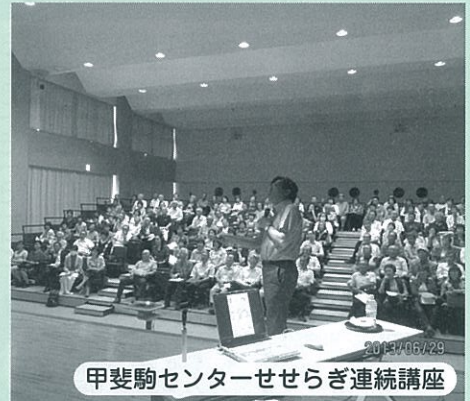
甲斐駒センターせせらぎ連続講座