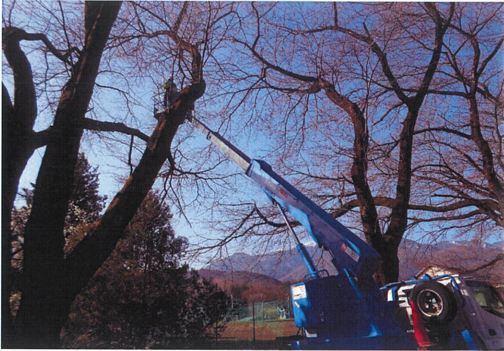
眞原桜並木天狗巢病木処理