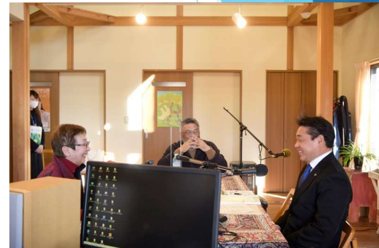
ラジオ番組収録（FM八ヶ岳小淵沢スタジオ）