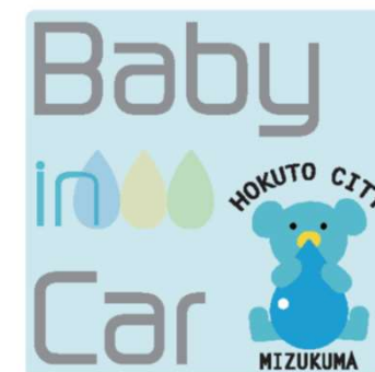
車用「ミズクマ」マグネット