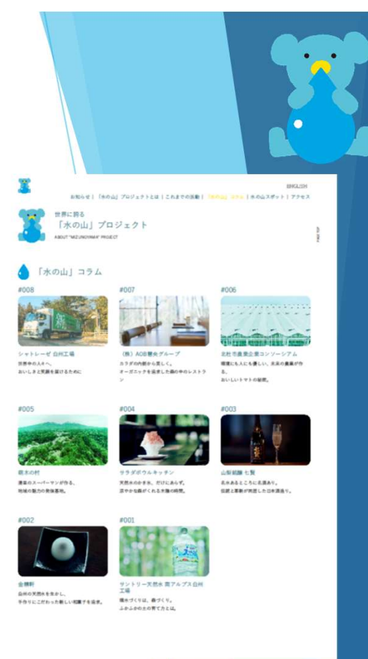
パートナー企業コラムページ