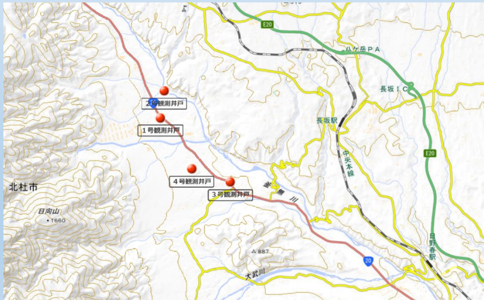
【図2】 地下水位観測地点