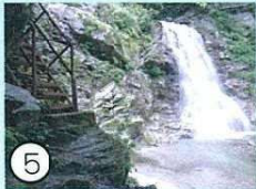
⑤ 二の滝 (初見の滝)