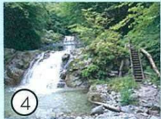
④ 一の滝 (魚止の滝)