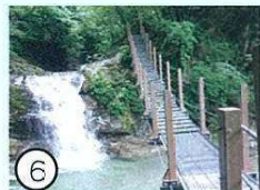
⑥ 三の滝 (見返の滝)