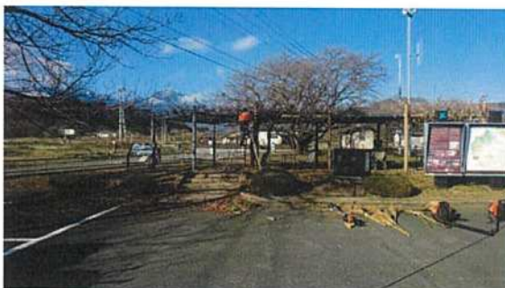
◇つるの垣根の剪定作業