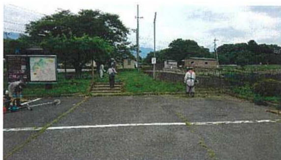
◇公園及び駐車場周辺の草刈り