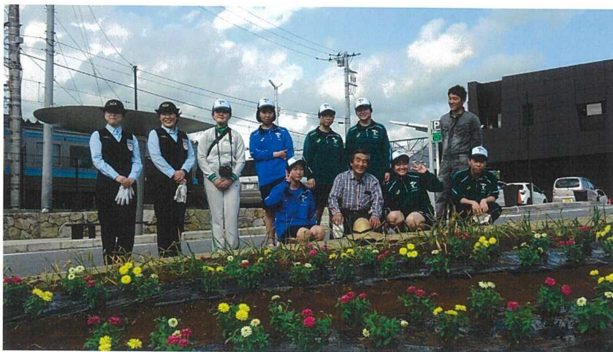
◇作業記念写真（帝京三高生と一緒にいる）