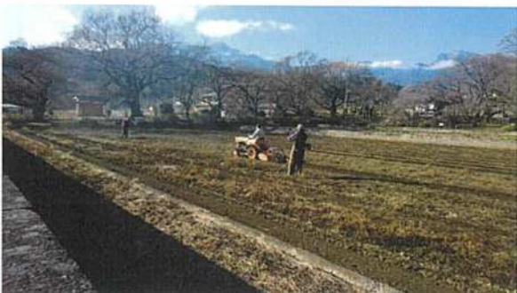
◇チューリップの圃場整備