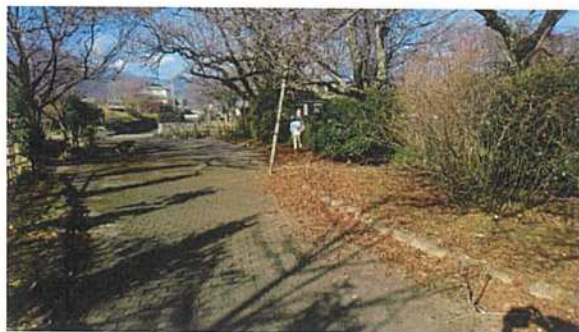
◇神代桜への通路の落ち葉片付け作業