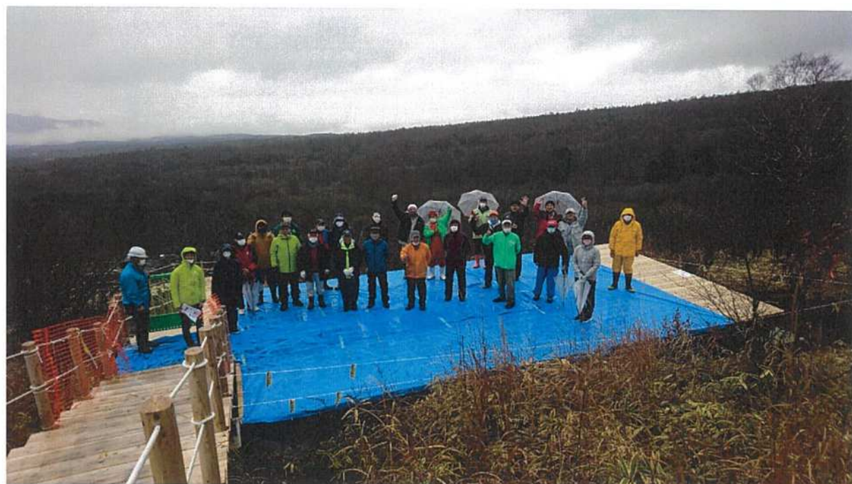
◇デッキでの記念撮影