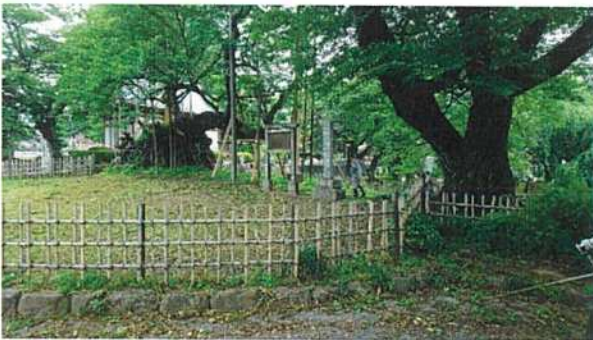
◇桜の生育状況も良好