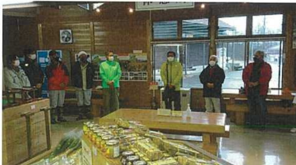
来賓挨拶（山梨県観光資源課長）