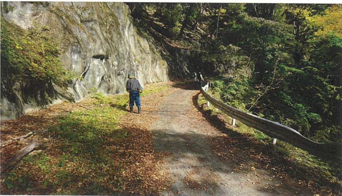
◇通路内の歩道確保作業