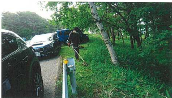
◇駐車場周辺の除草