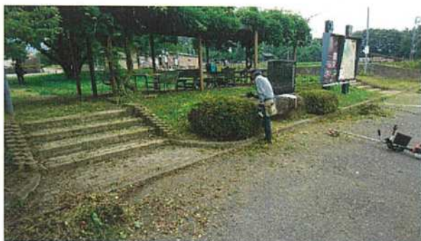
◇駐車場脇生垣のカット作業