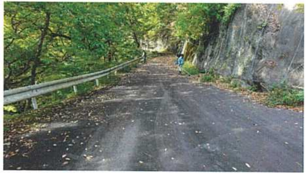
◇通仙峡内の道路脇の草刈り作業