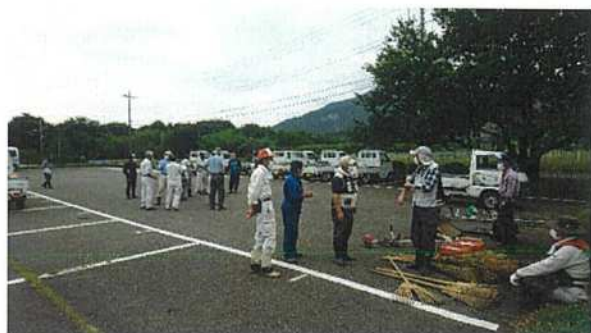
◇作業前・準備状況