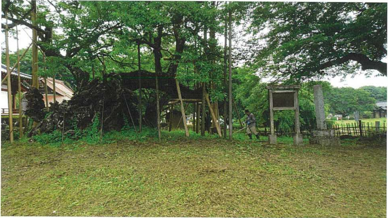
◇神代桜周辺の草狩り風景