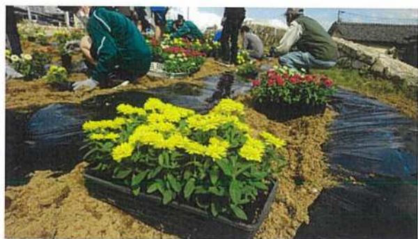
◇ヒナギクやパンジーの苗