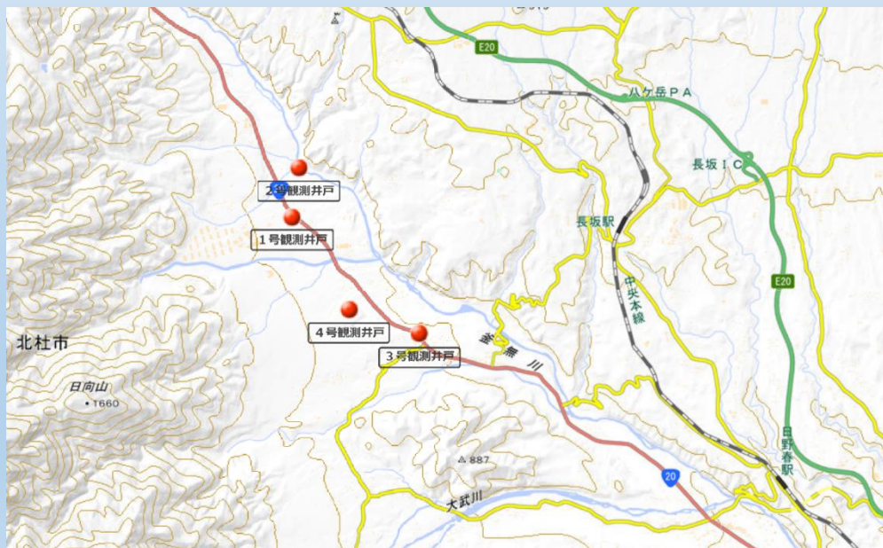
【図2】 地下水位観測地点