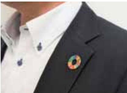
スーツの襟元などにつけている人も多いSDGsのバッジ。

17の目標はすべて関係しているため、一つでも欠けると、最終的な目標達成になりません。17番目の目標「パートナーシップで目標を達成しよう」にあるように、すべての人が協力しあつてこそ達成できる目標なのです。