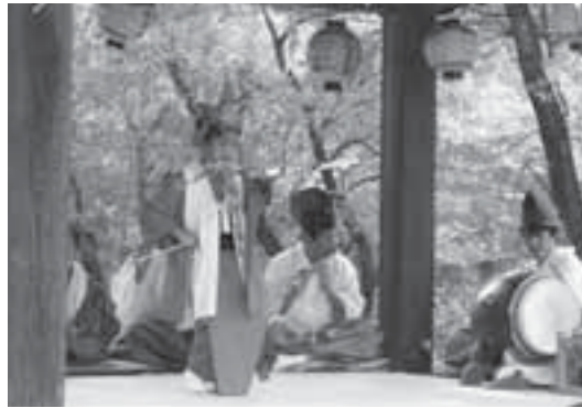
巫女の邪気を浄める弓矢の舞

御幣、鈴、扇を持って舞う「仁の舞」で神霊を招き、剣を持って舞う「剣の舞」で悪霊を払い、弓矢を持ち舞う「弓矢の舞」で巫女の邪気を清めます。ここまでは巫女は交代しながら一人ずつ舞います。最後に、巫女二人で鈴と柵 さかき を持って舞う「柵の舞」で神霊は巫女に乗り移るとされます。