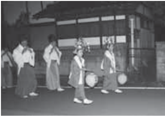
巫女を先頭に、笛や太鼓を鳴らしながら箕輪新町内を練り歩きます。

「おんねり」を終えると、引き続き金刀比羅神社で五穀豊穰、家内安全、厄病除け祈願、収穫への感謝を込め巫女舞が行われます。