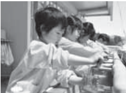
例えば、水道の蛇口をこまめに閉めること。これも目標6「安全な水とトイレを世界中に」の達成につながります。

一人ひとりの行動は小さいかもしれませんが、SDGsという共通の目標があれば、協力し合うきっかけとなり、やがては大勢の意識と行動を変え、大きな目標を達成することにつながっていくのです。