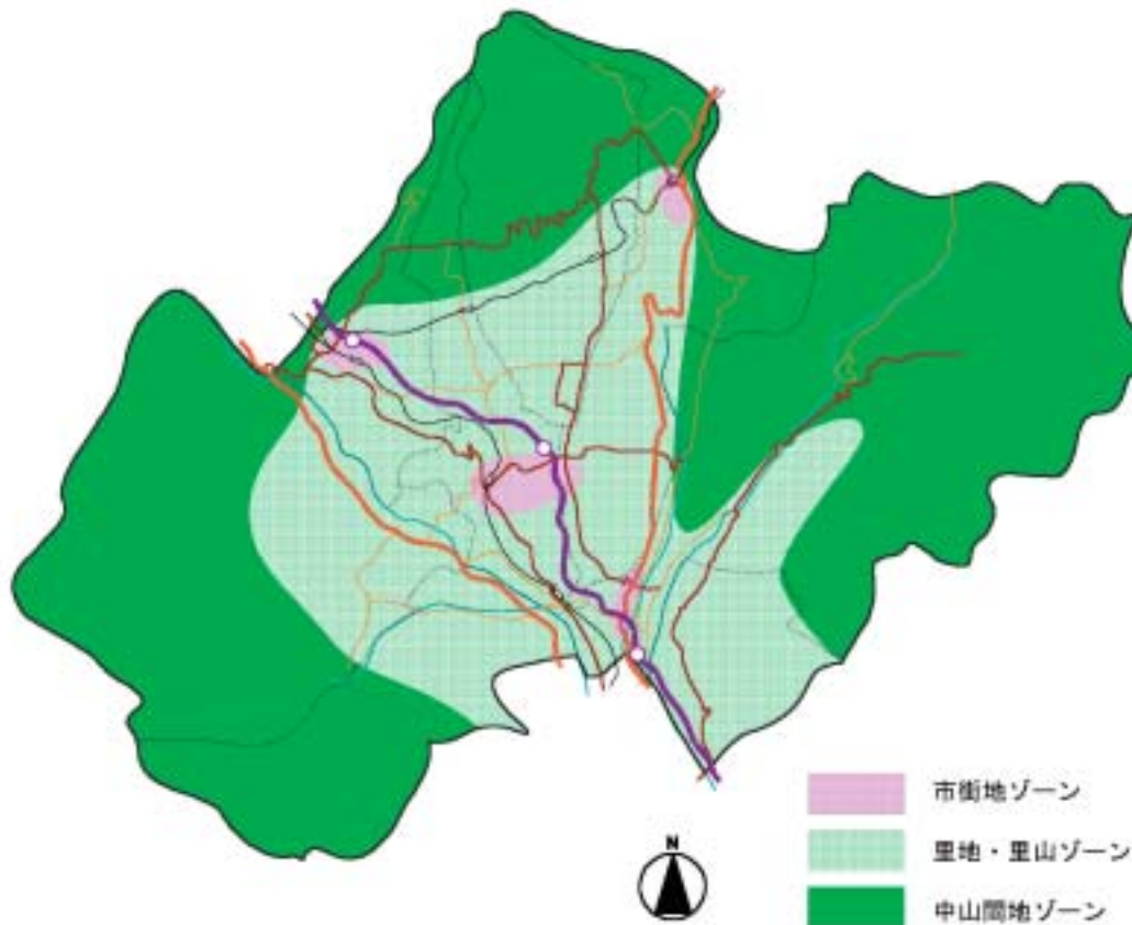
【北杜市ゾーニング図(概略図)】